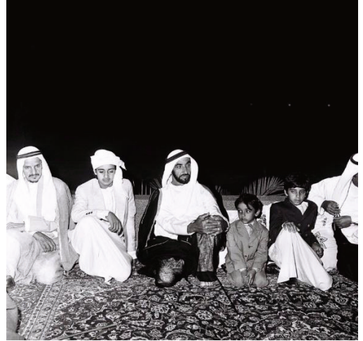
Sheikh Zayed bin Sultan Al Nahyan, celebrating the Malid with his sons Mohammed, Hamdan and Hazza